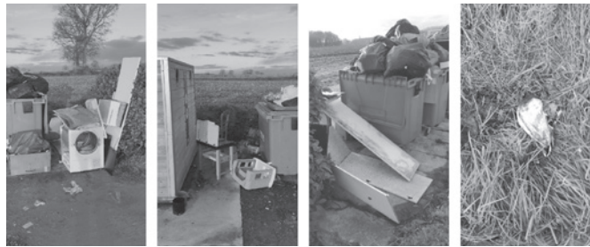
Site d'apport volontaire à La Clôture et aux Poissonnais

Ces comportements sans gêne sont intolérables. Ils nous contraignent à mobiliser des moyens humains, techniques et financiers supplémentaires. Ces actes d'incivisme sont des infractions prévues par le code de l'environnement. Il sera tout fait pour identifier les auteurs et les poursuivre.