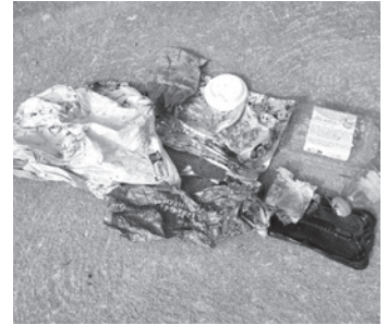
Déchets récoltés en bordure de voie entre St-Pierre et la Ville Brien (1 km)

M alheureusement nous sommes toujours confrontés à des dépôts sauvages récurrents d'objets et de déchets de toutes sortes effectués par des personnes peu scrupuleuses :