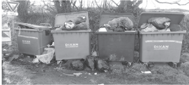
Site d'apport volontaire aux Poissonnais

L'abandon illégal de déchets par des particuliers ou des professionnels n'a aucune raison de persister car la totalité des déchets (ordures ménagères, papiers, cartons, plastiques, déchets végétaux, matériaux, encombrants...) dispose aujourd'hui d'une filière de collecte et d'élimination appropriée.