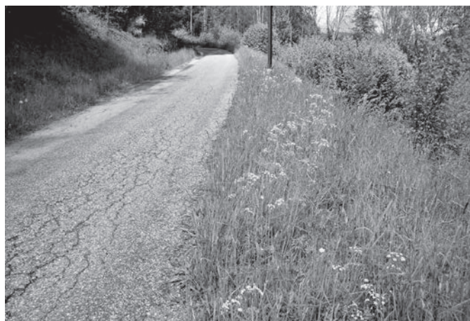
Exemple de zone de fauchage tardif dans les Vosges