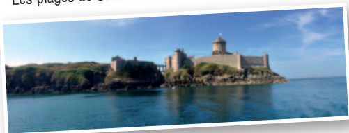
De nombreux sites touristiques dans les environs