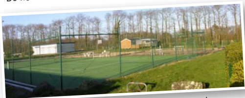
Des équipements de loisirs aux abords du camping