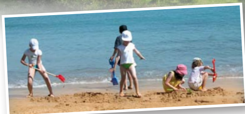
Les plages de Saint-Jacut et Saint-Cast à 10 minutes

Des équipements accessibles : dans l'enceinte les plus jeunes pourront profiter d'une aire de jeux. Accès libre au terrain de sport, tennis, et au boulodrome attenant au camping. Accès internet (Wi-Fi).