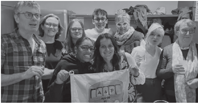
Bénévoles à la représentation du dimanche